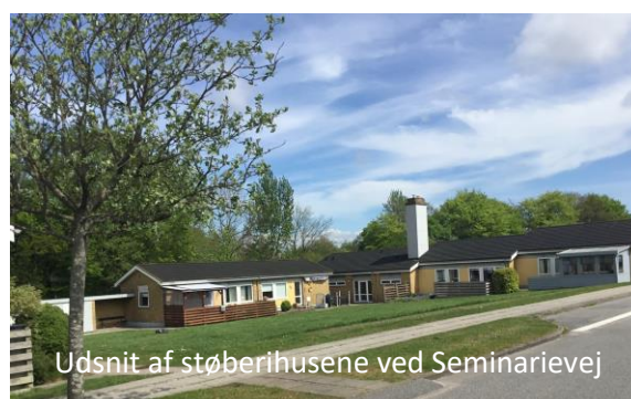
Udsnit af støberihusene ved Seminarievej