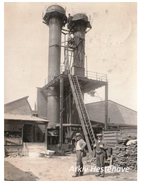
Jernstøberiet fik nye højovne i 1925

I 1920 udvidedes fabrikken på grunden mod vest.